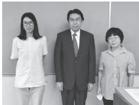
お手伝いいただいた方