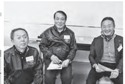
お手伝いの富士山吉原RC と富士RCのメンバー