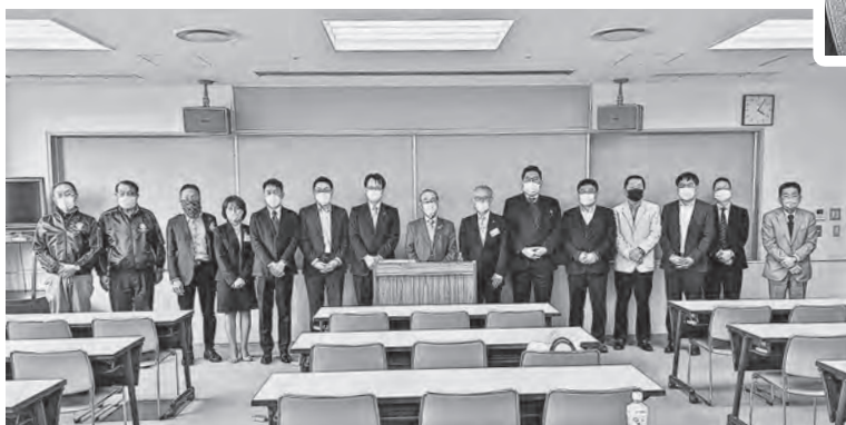
外部相談員の皆さま