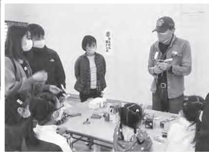
かんたん紙トンボ