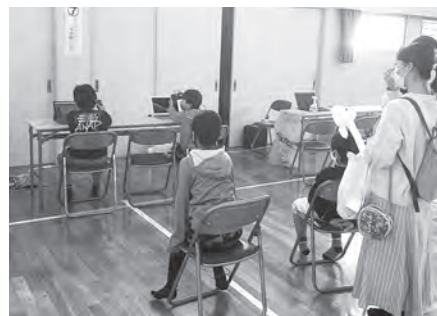
フライトシミュレーターを体験しよう!