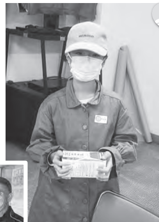
びっくり箱を作ろう!