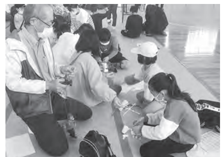
どうぶつマリオネット