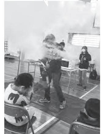
ミニサイエンスショー