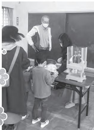
うごくおもちゃであそんでみよう!