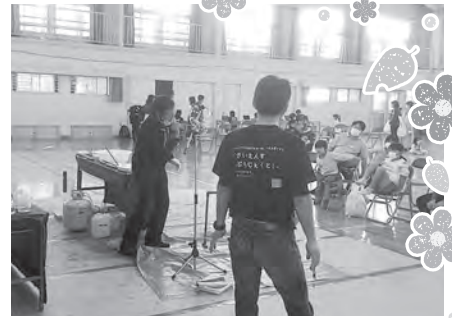
シャボン玉ショー