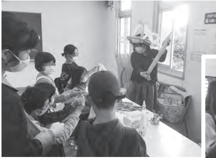
バルーンアートを作ってみよう