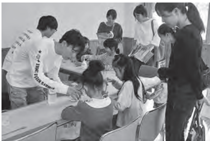
透明なキャンドルを作る