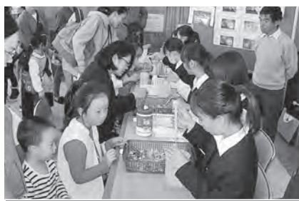
ハーバリウムの芳香剤を作ろう