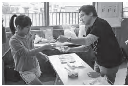
つかめる水で遊ぼう！