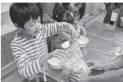
ダイラタンシーを体感しよう！