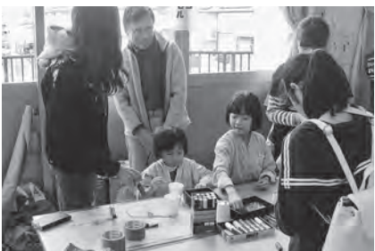
ピコピコカプセル