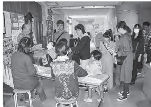
入場者が多数並び受付も大忙し