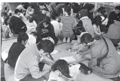
ロボットのマリオネットを作ろう