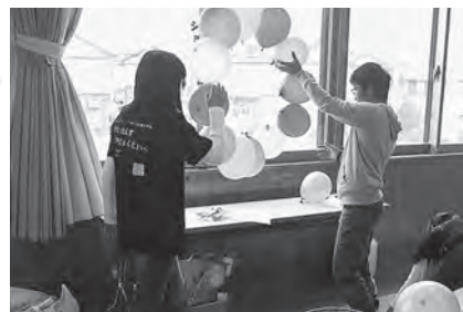
ミニサイエンスショー