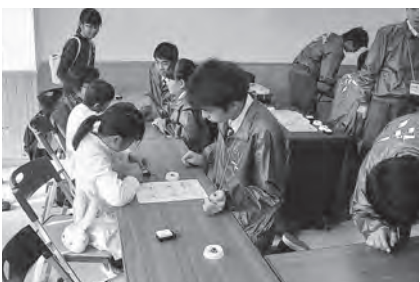
音と光の電子工作