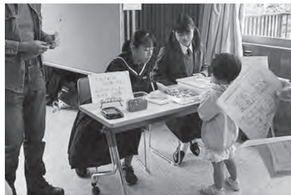
ストローロケットを飛ばそう！