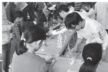
さわって遊ぼう！ふわふわゼリー