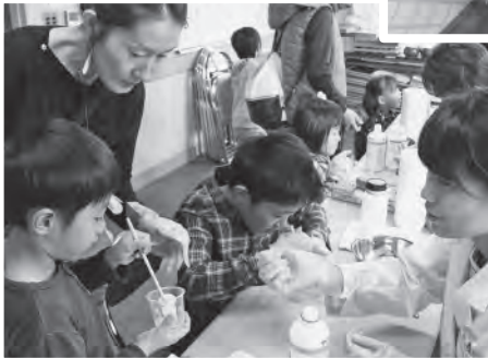
スーパーボールづくり