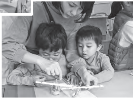
オリジナルキャンドル を制作