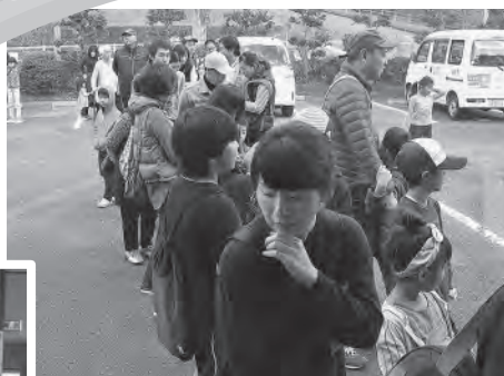
入場者が多数並び 受付も大忙し