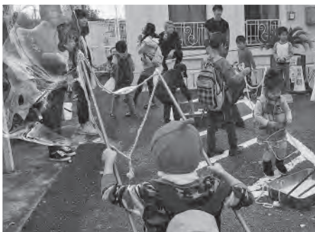
大きなシャボン玉づくりに挑戦