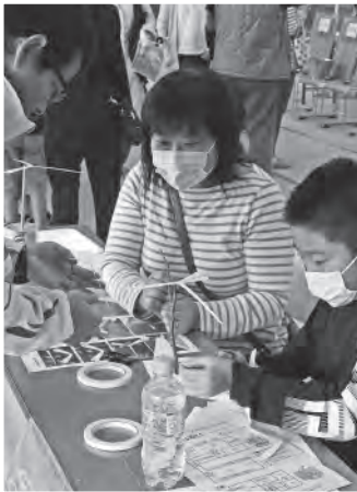
バランスストーンに挑戦