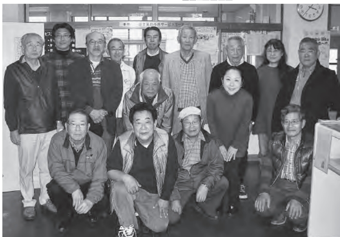
参加会員集合写真