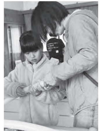
バルーンアートでブードルづくり