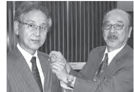
森会長より入会のバッジを贈呈