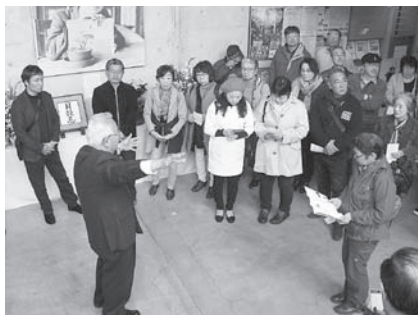
ごんぎつねの里にて見学