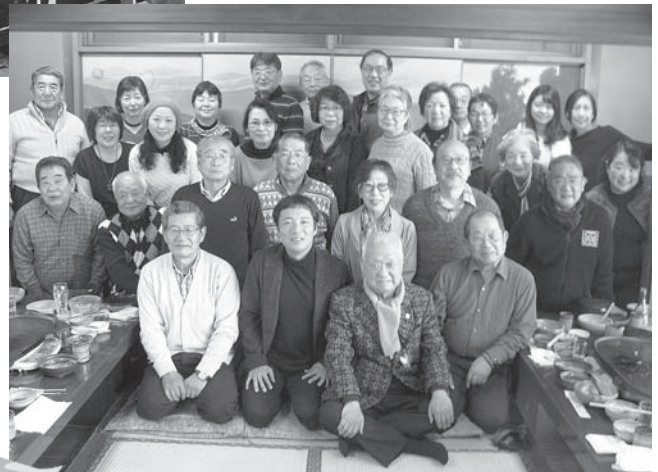
集合写真 (知多牛ステーキ会場にて)