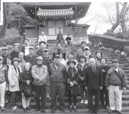
奥山方広寺で集合写真