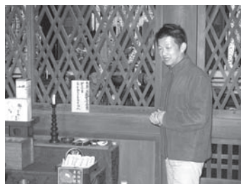
摩訶耶寺で説明を