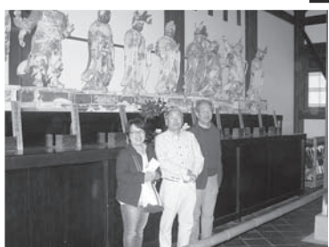
宝林寺二十四善神立像の前で