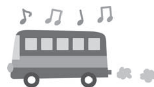
一路浜松へ バスの中