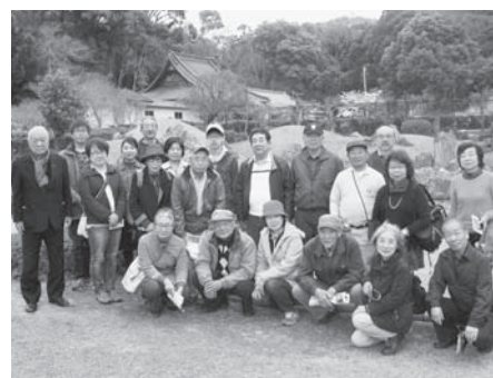
きれいな庭で記念写真