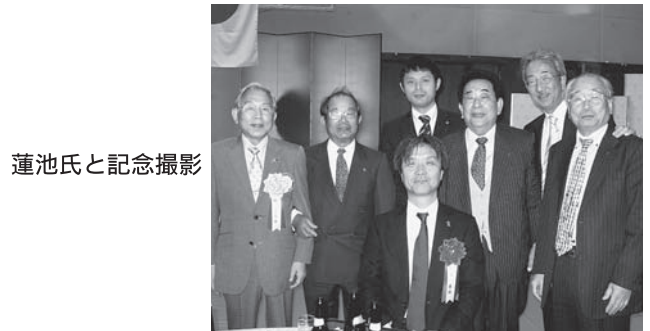
蓮池氏と記念撮影