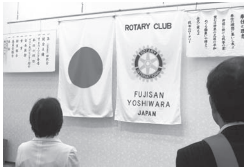
ロータリーソング「奉仕の理想」