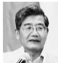
赤淵副会長より ビジターの紹介